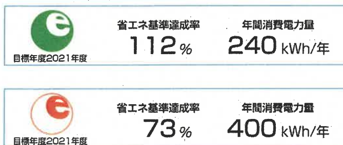
[図3] 省エネルギーラベル (例)